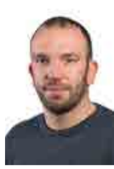
Jan Beck Selliner Wählergemeinschaft