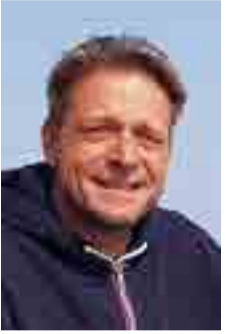
Helge Wurch FDP-Fraktion