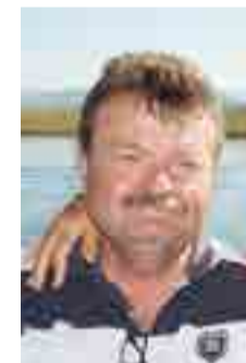
Lothar Henke FDP-Fraktion