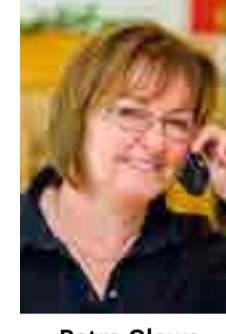
Petra Glawe FDP-Fraktion