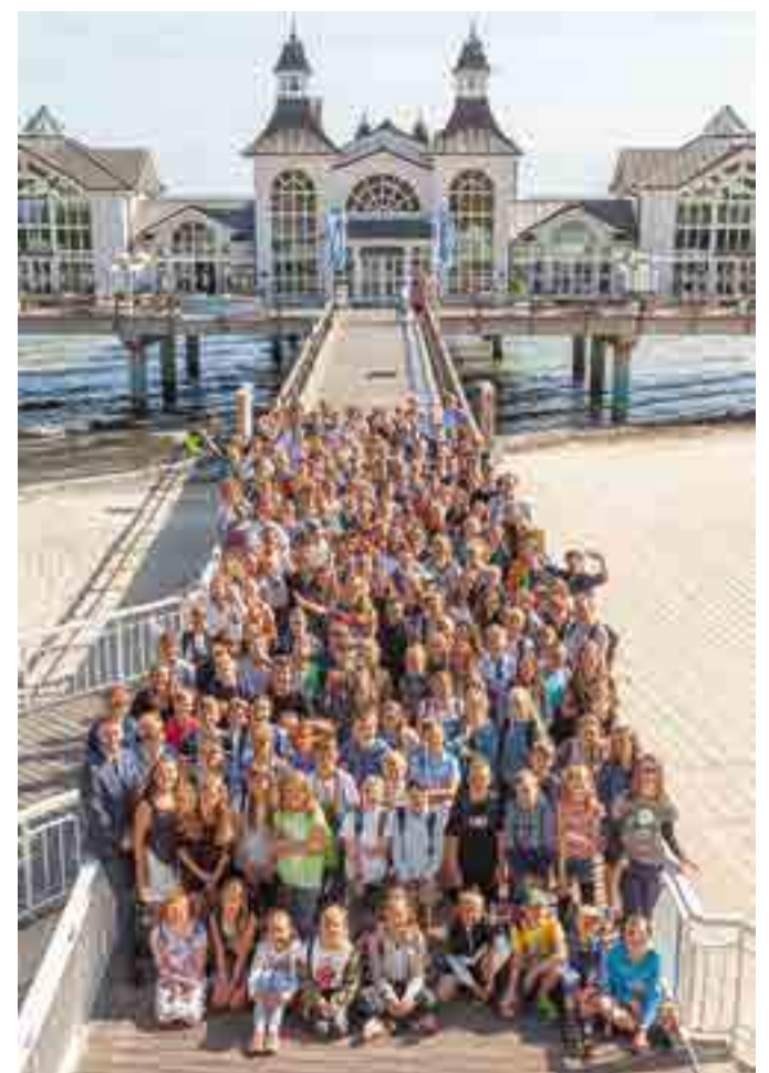
Die 200 SchülerInnen im Schuljahr 2018/2019. Im Schuljahr 2019/2020 sind es bereits 250.