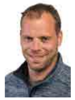
Henry Mix Selliner Wählergemeinschaft