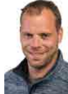
Henry Mix Selliner Wählergemeinschaft