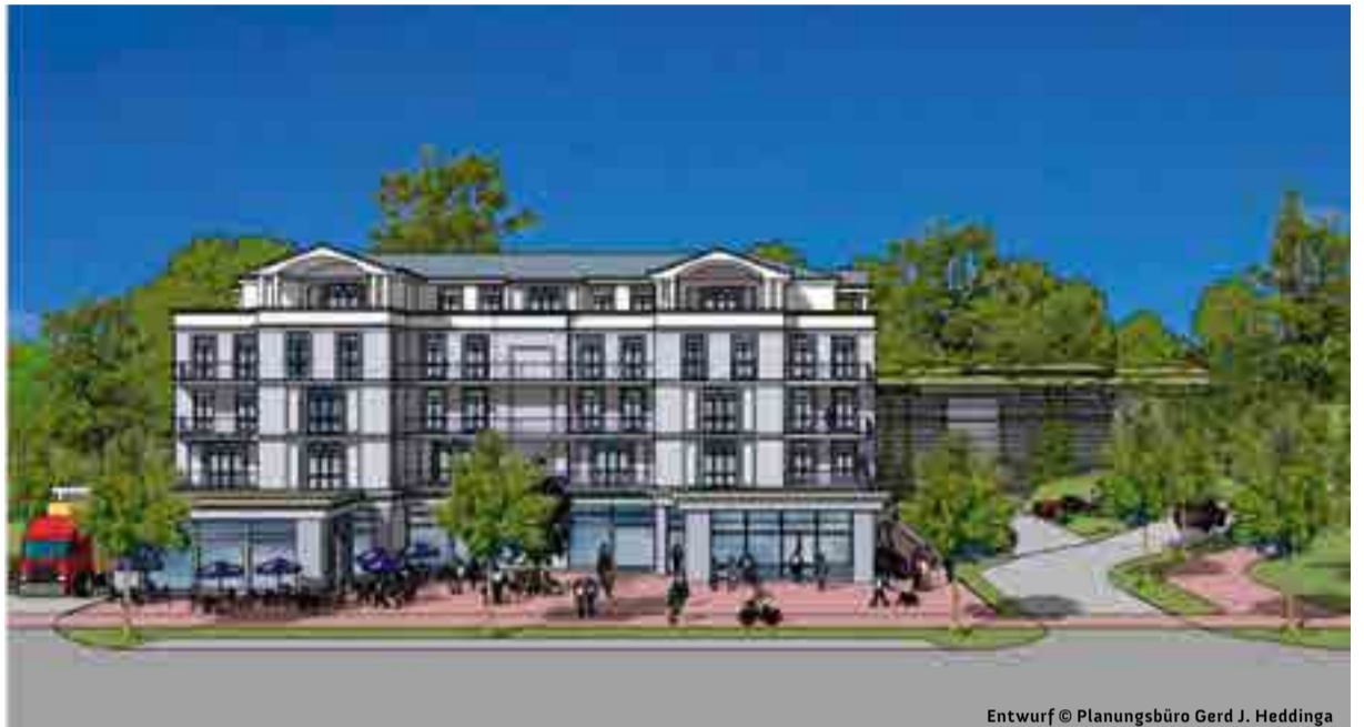
Entwurf © Planungsbüro Gerd J. Heddinga

W egweisende Beschlüsse in Übereinstimmung mit der Tourismuskonzeption der Gemeinde wurden auf der letzten Gemeindevertretersitzung gefasst. Nun sollen Maßnahmen umgesetzt werden. Die Mitglieder des Tourismus- und Verkehrsausschusses sprachen dafür bereits zuvor eine Empfehlung aus. Sie wollen den Bau eines Parkhauses, Fahrradständer in der Wilhelmstraße sowie auf dem Seebrückenvorplatz, die Erhöhung der Parkgebühren sowie ein Durchfahrts- und Parkverbot für Reisebusse im Ortszentrum. Um den Verkehr aus der Wilhelmstraße zu verbannen, wird nun ein Parkhaus in Kombination mit Mietwohnungen, gebaut werden. Dazu wird die Gemeinde in Kürze eine Ausschreibung veröffentlichen. Der Standort ist schon lange klar: die derzeit als Parkplatz genutzte gemeindliche Freifläche des früheren Kaufhauses »rationell« in der August-Bebel-Straße/Ecke Kirchstraße. Einig war sich das Gremium, dass mit dem Parkhaus auch ein neues Parkleitsystem eingeführt werden müsse. In der Wilhelmstraße sollen hingegen gar keine Parkplätze mehr zur Verfügung gestellt werden. Wenn die Wilhelmstraße verkehrsberuhigt ist – wie bei den Radrennen oder Straßenfesten bereits zu beobachten war – werden die Leute es genießen, auf der Straße zu gehen •