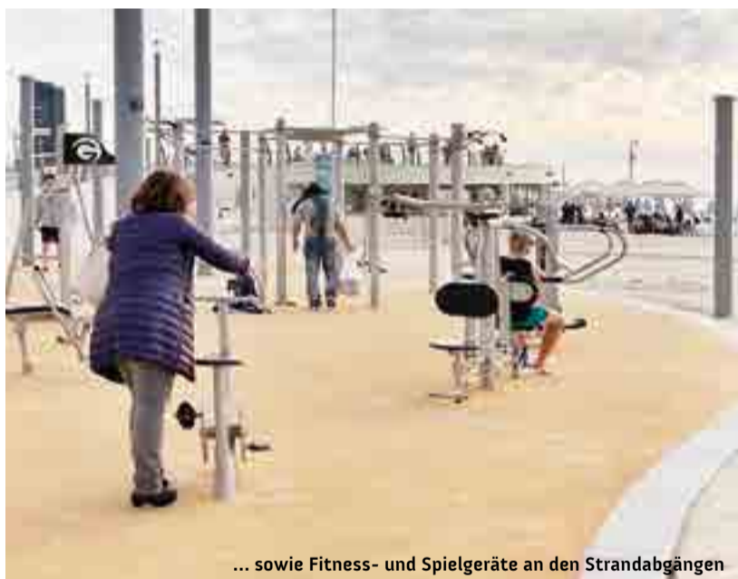
... sowie Fitness- und Spielgeräte an den Strandabgängen