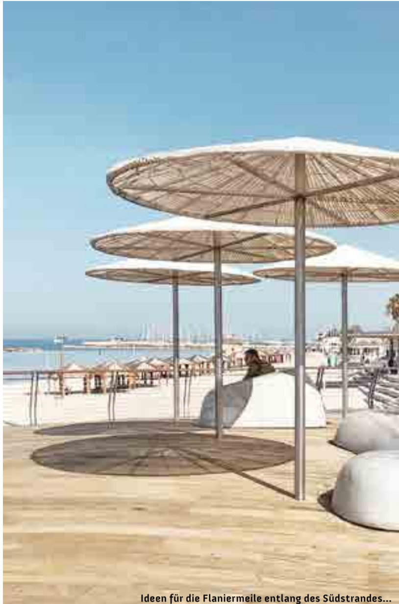
Ideen für die Flaniermeile entlang des Südstrandes...